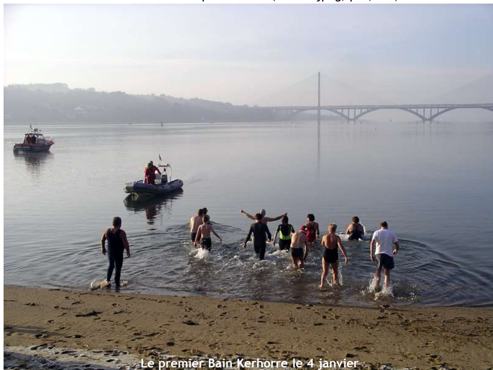
Le premier Bain Kerhorre le 4 janvier

Vous aussi, envoyez votre photo sur la vie de la commune par courriel : info@mairie-relecq-kerhuon.fr (format jpeg, psd, tiff)