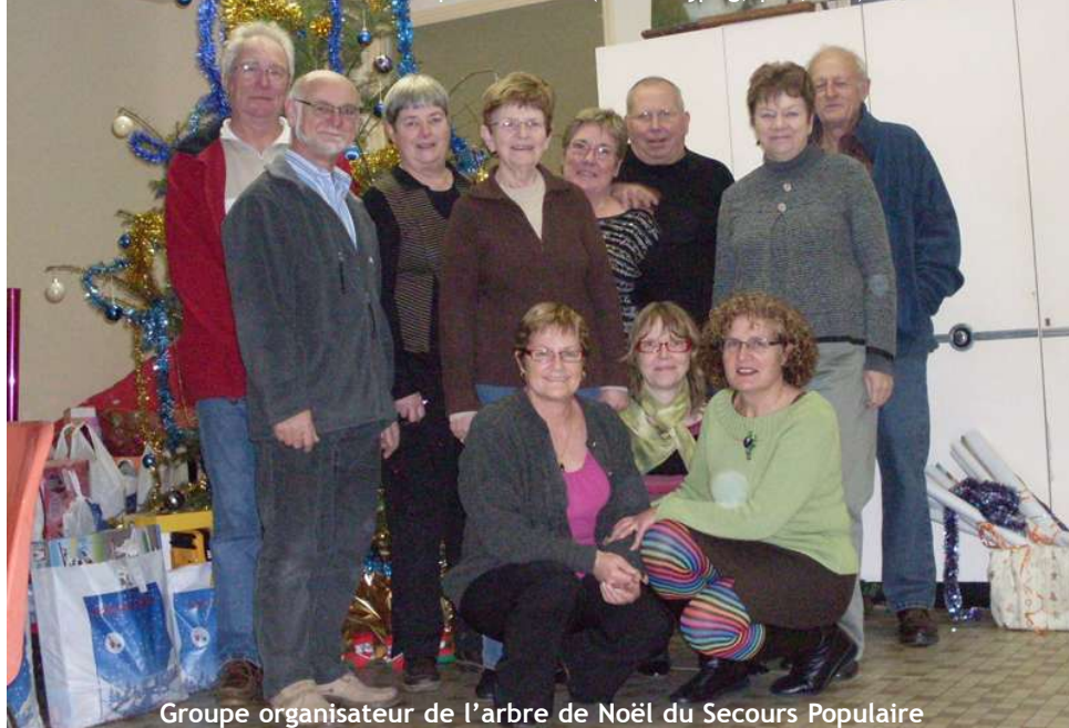
Groupe organisateur de l'arbre de Noël du Secours Populaire

Vous aussi, envoyez votre photo sur la vie de la commune par courriel : info@mairie-relecq-kerhuon.fr (format jpeg, psd, tiff)